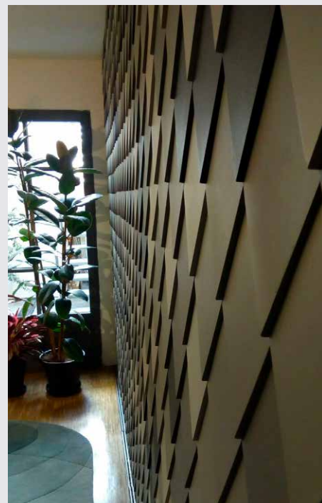
Peça Pirarucu foi um dos destaques de exposição que valorizou criações brasileiras na principal semana de design do mundo.

Organizada pela revista Casa Vogue, uma das principais publicações do segmento no país, a exposição foi uma das atrações do pavilhão "Be Brasil", espaço organizado pela ApexBrasil que dá projeção internacional às criações em destaque no cenário nacional.