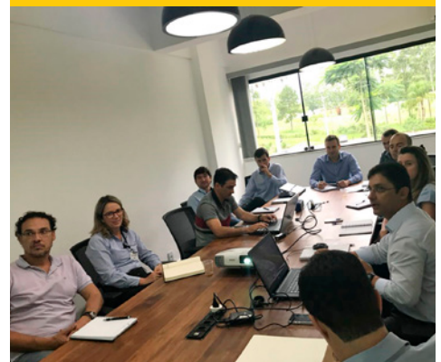
Na oportunidade os gestores aprovaram o cronograma de ações para o ano de 2018

As reuniões acontecerão mensalmente de modo que, em conjunto, possam ser tomadas as melhores decisões para a empresa.