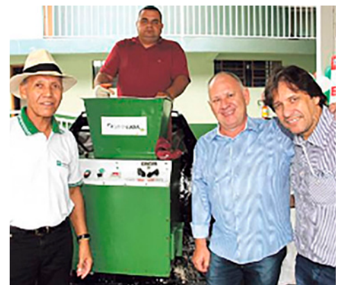
Santa Luzia participou da mostra e na oportunidade alocou uma máquina de degasagem de isopor. Colégio é modelo de boas práticas em reciclagem.